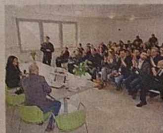
La cerimonia di inaugurazione

nia ha detto: «La cooperativa sociale Sottosopra onlus è nata nel 2001 grazie a un gruppo di operatori sociali. Il suo nome, così come il logo raffigurante una talpa che emerge in superficie, vuole indicare l'importanza di rendere visibile ciò che spesso rimane nascosto, l'impegno per fare affiorare le potenzialità, le risorse, le opportunità». E ancora: «I principali settori di intervento della cooperativa sono la disabilità, i minori in situazione di difficoltà (sono una novantina) e, di recente, anche il turismo sociale».